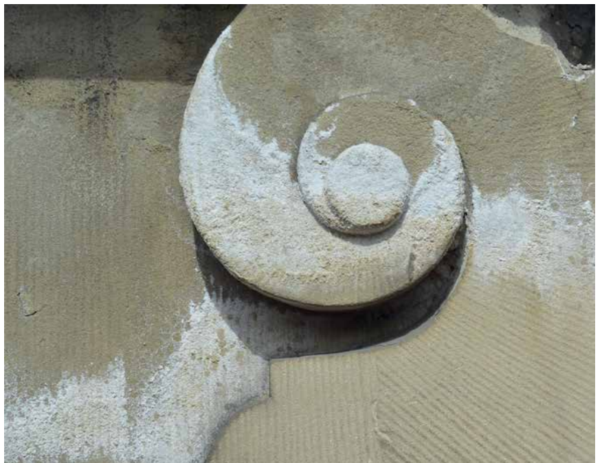
Saltudfældninger i detalje fra Børsen i København

“Indsigt i sandstenens geologi og fysiske egenskaber er afgørende for at imødegå nedbrydningsmekanismer, der inddeles i kemiske og fysiske/