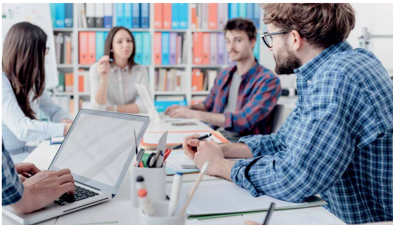
Allerede under praktikken har studerende gode muligheder for at opbygge netværk.

Af Lene Søemod, kommunikationskonsulent i Konstruktørforeningens a-kasse – en del af FTFa