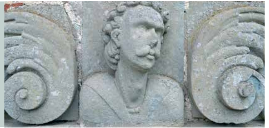
Gotlandsk sandsten i en detalje fra en vinduesindfatning på Voergaard Slot i Nordjylland.

Artiklen er en journalistisk bearbejdet version af BYG-ERFAs erfaringsblad – ‘Sandsten – nedbrydning, istandsættelse og vedligehold’ (ID-nr. (41) 21 11 26). Hent det på Byg-erfa.dk .